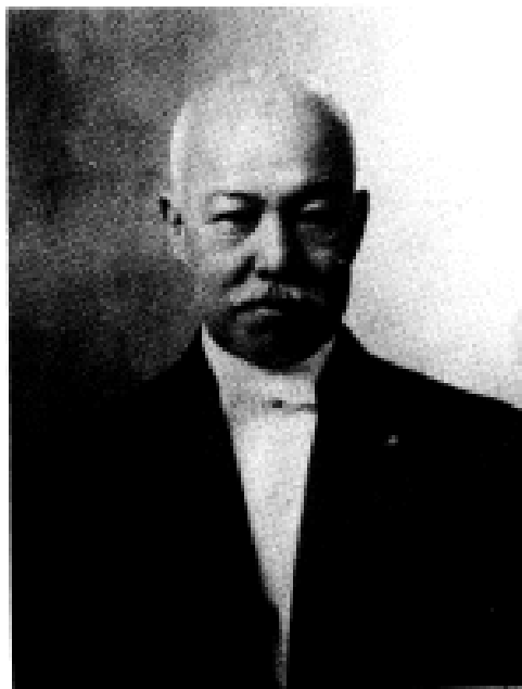
政界や地方自治に活躍した早川電全