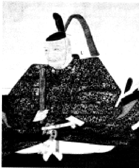
勝重の肖像（長岡寺）

職につくとただちに、「まず無欲なれ、財貨は身を破るものと」と説き、府内に名声を博した。一五九〇年、家